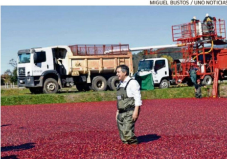
MIGUEL BUSTOS / UNO NOTICIAS