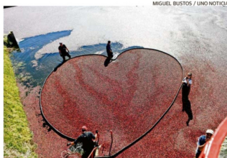
MIGUEL BUSTOS / UNO NOTICIAS