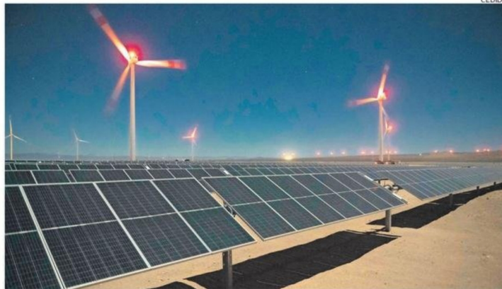
EL SECTOR ENERGÉTICO ES UNO DE LOS MÁS RELEVANTES EN LA REGIÓN.

Asimismo, relevó el dinamismo reciente del sistema de evaluación ambiental, pues “solo en el primer mes de gobierno ingresaron a evaluación más de 17 mil millones de dólares, lo que es una cifra histórica. Evaluaremos en conjunto la forma de potenciar al equipo local del SEA con el fin de cumplir con la agilización de plazos ante la importante responsabilidad que tenemos como institución”.