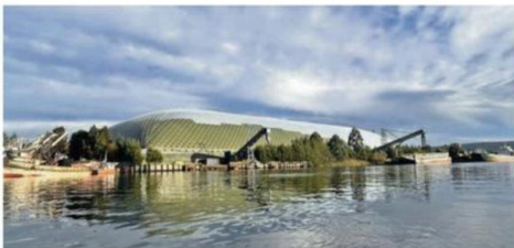
SE CAMUFLA EN EL ENTORNO PARA NO INTERRUMPIR EL PAISAJE.

les, la docente transformó esta gran infraestructura en un elemento que se integra armónicamente al ecosistema fluvial y urbano.