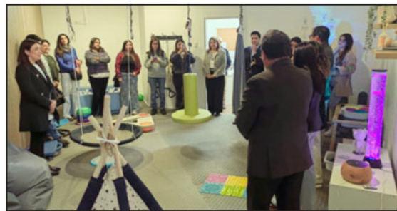
La nueva sala de neurobienestar cuenta con implementos sensoriales diseñados para apoyar la regulación emocional de los estudiantes.