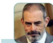
PIER KARLEZI (PNL)