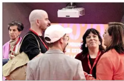
La senadora y presidenta del PS, Paulina Vodanovic; la timonel del FA, Constanza Martínez; el exministro Giorgio Jackson y la exlegisladora Isabel Allende son parte de la comitiva nacional en España.

EDITORIAL: "PREOCUPACIÓN EN SEGURIDAD PÚBLICA" | A 3