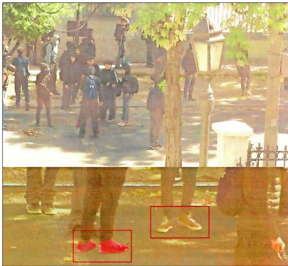
Debido a que los imputados actúan encapuchados, el OS9 de Carabineros estableció la participación de alumnos del INBA, comparando zapatillas y vestimentas usadas en delitos.

El OS9 analizó los registros e informó a la fiscalía que “en las paredes del dormitorio se ob-