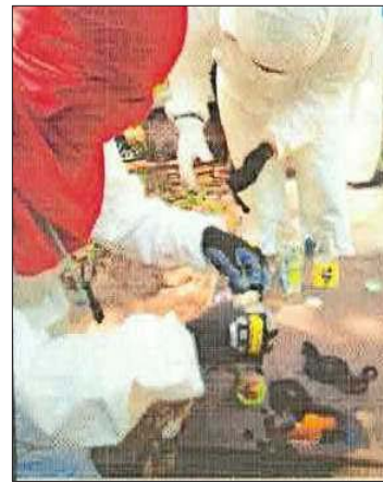
Imputados guardaban en teléfonos evidencias de molotov que sirvieron de pruebas en su contra.