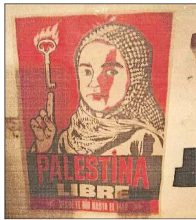
La causa pro Palestina también está entre las materias de interés de imputados, según investigaciones.