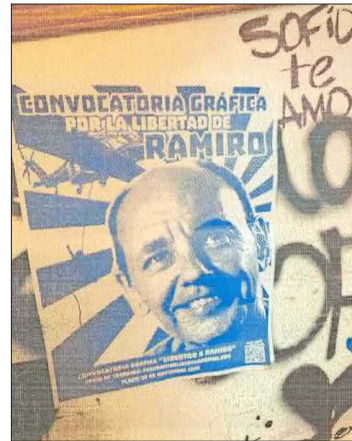
Afiches recuperados en domicilios de estudiantes en apoyo a libertad de exfrentista.

está marcado por el uso de capuchas icónicas en el anarquismo como el “Ukuku”, indican cono-