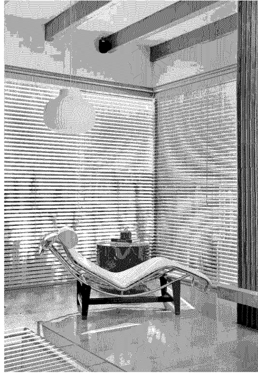
En el living, un rincón de lectura con la chaise longue LC4 y una lámpara colgante de la firma Muto.