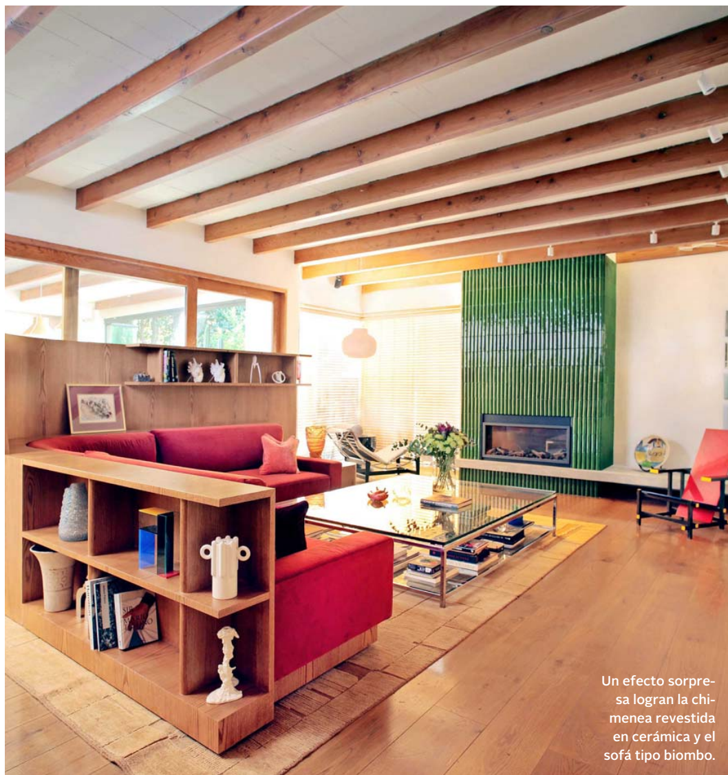
Un efecto sorpresa logran la chimenea revestida en cerámica y el sofá tipo biombo.

Texto, M. Cecilia de Frutos D. Producción, Paula Fernández T.