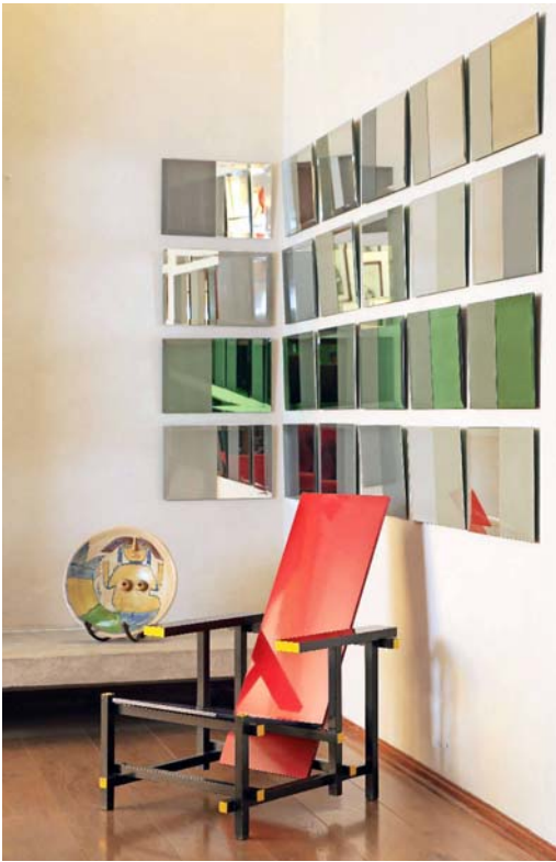
Clásicos del diseño y piezas contemporáneas; la silla "Red & Blue" (1917) y serie de espejos de Juan Pablo Fuentes.