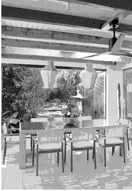
En la terraza instalaron un piso de hormigón con tinte rosado, de Grava Design.