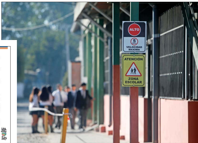
DENUNCIAS.— En la Región de Valparaíso, entre el 23 de marzo y el 13 de abril se registraron 101 denuncias por amenazas. El regreso a clases se realiza de forma permanente bajo resguardo policial.

El seremi de Seguridad de Valparaíso, coronel (R) Hernán Silva, indicó esta semana que las amenazas en establecimientos educacionales tienen efectos concretos en la capacidad operativa de las policías: "Llevamos sobre 20 denuncias (en la región) por estas amenazas que instalan los alumnos en los colegios generan una distracción de personal policial que debiera estar focalizado en el combate a la delincuencia". Solo en la Región de Valparaíso, entre el 23 de marzo y el 13 de abril hubo 101 denuncias de amenazas. Además, cuando se retoman las clases, siempre es con el apoyo de