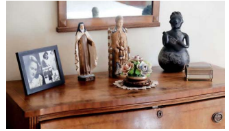
Muchos de los objetos que hay en la casa son regalos que le hicieron durante su mandato.