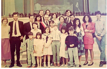
Un retrato familiar de Aylwin como Presidente, con todos sus hijos y nietos.