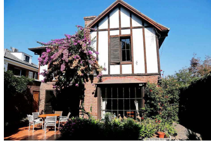
La casa fue diseñada el año 56 por el arquitecto Tomás Reyes, quien después fue senador DC. Fue el hogar de la familia durante 65 años, y es posible que se convierta en el domicilio particular de quien decida desembolsar los poco más de 700 millones de pesos en que está tasada la propiedad.