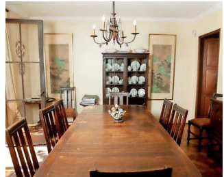
Uno de sus más célebres invitados a este comedor fue el presidente de Estados Unidos, George Bush, el 6 de diciembre de 1990.