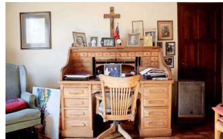
En este escritorio, regalado por su suegro, el expresidente trabajaba cuando no iba a su oficina.