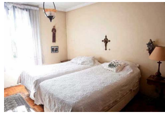
En este dormitorio murió Patricio Aylwin el 19 de abril de 2016, acostado en su cama, junto a la paz que le daba recordar algunas poesías que su memoria atesoró hasta los últimos días, según cuentan sus cercanos.

El último cumpleaños que se celebró en la casa de Arturo Medina fue el 10 de marzo del año pasado. Ese día, Leonor Oyarzún habría cumplido 105 años. Hijo, nietos y bisnietos cantaron fuerte el cumpleaños feliz, se rieron y disfrutaron una vez más en la casa que alguna vez mantuvo su reja abierta día y noche, que, a pesar de ser un lugar donde se zanjaron decisiones políticas, la autoridad del presidente no cruzaba el umbral de la puerta. S