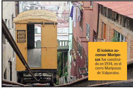
El icónico ascensor Mariposas fue construido en 1934, en el cerro Mariposas de Valparaíso.