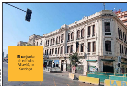
El conjunto de edificios Aillavilú, en Santiago.

“Tenemos que pensar en otras funciones contemporáneas, como, por ejemplo, readaptar esos inmuebles para la vivienda en espacios para la convivencia democrática o para colegios”.