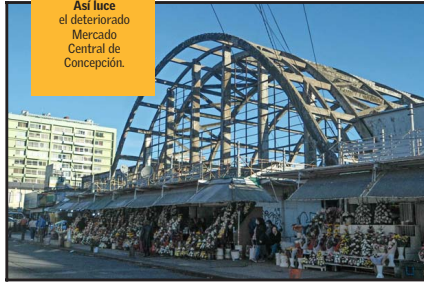
Así luce el deteriorado Mercado Central de Concepción.