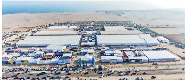
Exponor 2026 proyecta una participación récord de empresas en un contexto de expansión de la industria minera, consolidándose como un espacio clave para el encuentro y generación de nuevos negocios.

El nuevo ciclo de expansión que vive la industria minera comienza a reflejarse con fuerza en la próxima versión de Exponor 2026, exhibición internacional organizada por la Asociación de Industriales de Antofagasta (AIA) que este año alcanzará un total de 1.300 empresas expositoras, cifra récord que confirma el interés del sector por fortalecer sus redes comerciales y proyectar nuevas oportunidades de negocio.