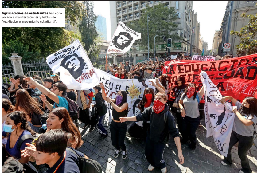
Agrupaciones de estudiantes han convocado a manifestaciones y hablan de 'rearticular el movimiento estudiantil'.