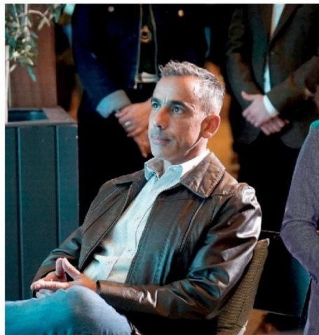
© Cristián Riffo , jefe de Medioambiente de Sodimac y jurado de los premios.