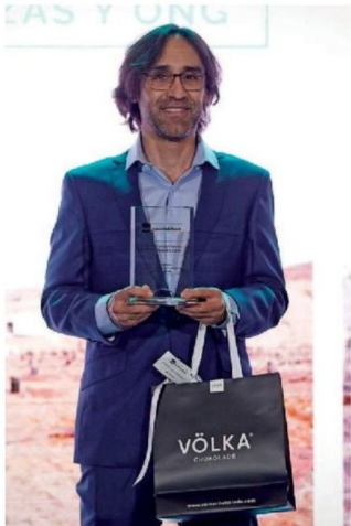
© Gerardo Soto , académico de la Facultad de Ciencias Ambientales de la Universidad de Chile.