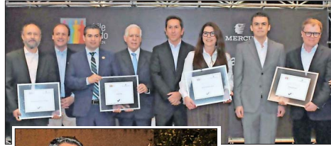
Grupo de empresas ganadoras del Sello de Distinción: Universidad Alberto Hurtado, OCG Chile, Grupo Guanta-Gacal y Statkraft Chile.