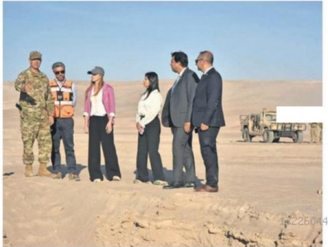
EL PLAN ESCUDO FRONTERIZO, IMPLEMENTADO POR EL GOBIERNO DEL PRESIDENTE KAST, BUSCA ENFRENTAR DE MANERA CONCRETA LA CRISIS MIGRATORIA A TRAVÉS DE UN TRABAJO QUE CONSIDERA TRES CAPAS: TECNOLÓGÍA, INFRAESTRUCTURA Y PATRULLAJE MILITAR.