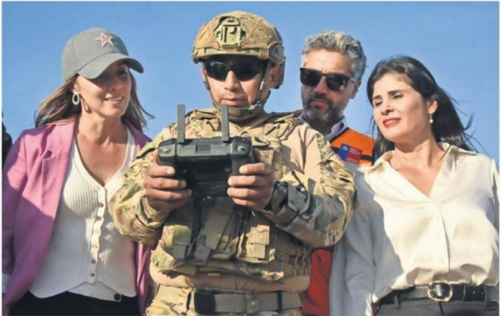
EL MINISTERIO DE OBRAS PÚBLICAS Y EL EJÉRCITO DE CHILE TRABAJAN CONSTRUYENDO LAS ZANJAS.

En el marco de su visita a la Región de Arica y Parinacota, la ministra secretaria general de Gobierno, Mara Sedini, se dirigió hasta la frontera de Chile y Perú para constatar en terreno el avance de la zanja, obra que forma parte del Plan Escudo Fronterizo que busca reforzar la seguridad en el norte del país.