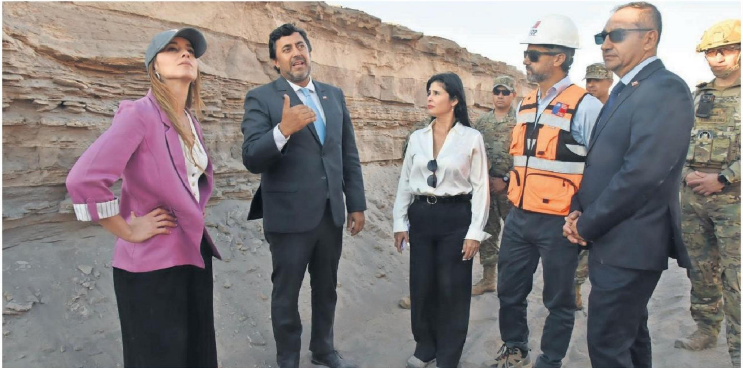
DURANTE LA VISITA, LA VOCERA DE GOBIERNO PUDO INSPECCIONAR LA OBRA QUE LLEVA UN 40% DE AVANCE, LO QUE SE TRADUCE EN MÁS DE 3 MIL METROS CONSTRUIDOS.