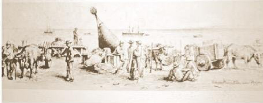
Comisión científica brasileña en el paso de Venus en Punta Arenas, 1882.