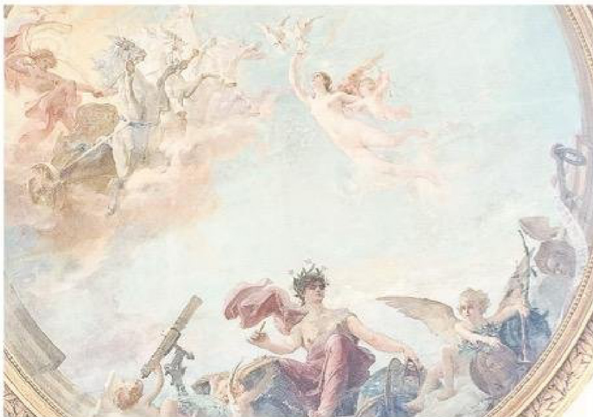
Paso de Venus en 1882.

ha efectuado en Punta Arenas. Numerosos colonos han sido atraídos por las genero-