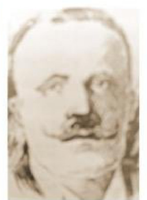
Francisco Ramón Sampaio Guzmán, Gobernador de Magallanes entre 1880 al 1889.