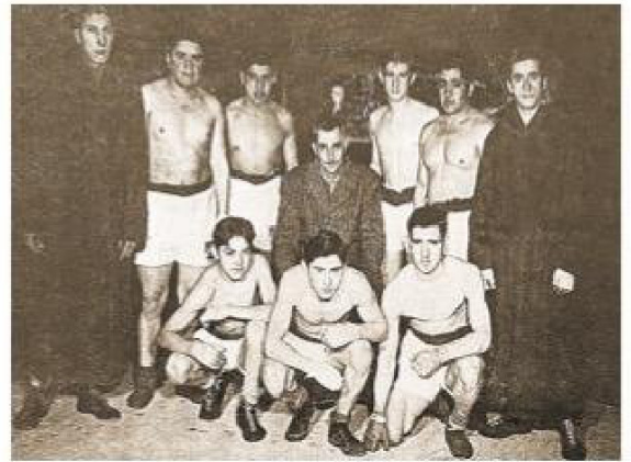
Por 18 años estuvo relacionado con el boxeo en distintos roles. La fotografía es de 1949. El aparece a la derecha.