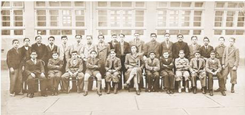
Su curso en el Liceo de Hombres en 1943. Es el tercero de derecha a izquierda, fila inferior, con zapatillas blancas.

El episodio más dramático de su carrera fue cuando el Tesorero General de la República lo llamó desde Santiago para pedirle que asumiera como tesoroero comunal en plena huelga del personal. Aceptó, lo que califica como "mi gran error". Los mismos gremialistas que lo propusieron se le vinieron en contra cuando comenzó a descolgar las banderas y adornos políticos que cubrían la oficina como árbol de Navidad. Sin embargo, sacó adelante la oficina, innovó con cajas volantes en distintos barrios de la ciudad para evitar que la gente tuviera que ir hasta la Tesorería, y convirtió su gestión en ejemplo para el resto del país. Después del golpe de 1973 lo dejaron fuera por haber sido tesoroero en la época de Allende, aunque nunca tuvo militancia política. Un almirante que lo investigó a fondo terminó diciéndole: "A usted le conozco hasta los callos que tiene. No le encuen-