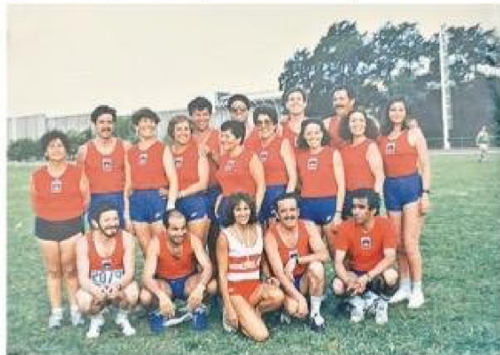
Con el equipo chileno en una corrida en Buenos Aires.