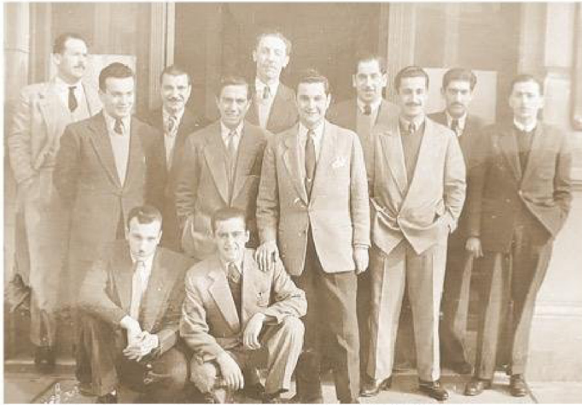
Apenas había llegado a la Tesorería. Es el segundo (de izquierda a derecha) de la fila inferior.