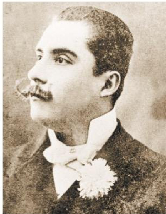
Una de las imágenes más conocidas de José Santos Chocano (1875-1934), prolífico autor peruano fallecido trágicamente en Chile.

En los seis años que duró su estadía en Chile, Santos Chocano vivió con gran austeridad, a menudo con di-