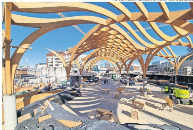
LAS OBRAS DE REPOSICIÓN SERÁN RETOMADAS, PROBABLEMENTE, EN PRIMAVERA.

Luego de este largo periplo de dificultades, frustraciones y tramitaciones, el miércoles 15 de abril de 2026, y en un trabajo inédito que tarda apenas seis días, el Consejo Regional