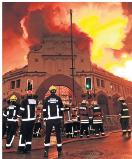
LA NOCHE DEL 20 DE ABRIL DE 2016 OCURRE EL INCENDIO.

aprueba con sólo cuatro votos en contra (de Lizama, Pacheco, Wickel y Gutiérrez) el presupuesto solicitado en el mensaje número 69 presentado al pleno por el gobernador René Saffirio, para dar continuidad a las obras de ejecución por un monto de 38 mil 999 millones