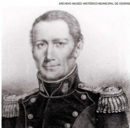
JUAN MACKENNA PROYECTÓ PARQUES EN LAS COLINAS DE PILAUCO.

Estando Juan Mackenna en la materialización de esa iniciativa, recibió una misiva del Cabildo de Santiago donde le co-