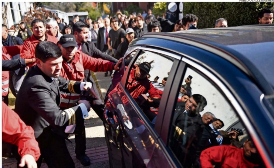
EN VALDIVIA, LA MINISTRA DE CIENCIA DEBÍO SALIR CORRIENDO MIENTRAS ERA GOLPEADA, EMPUJADA Y ROCIADA CON AGUA DE LA U. AUSTRAL.