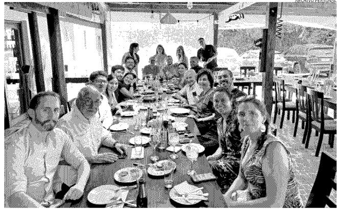
Junto a su familia. Tiene cuatro hijos de dos matrimonios: una mujer y tres hombres, y siete nietos.

—Usted tiene más de 60 años como cirujano, ¿por qué optó por esta especialidad? "Cuando comencé, Chile registraba 200 niños muertos por 1.000 nacidos vivos. Enton-