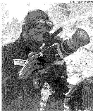
En sus tiempos de alta montaña, cuando escalaba el Everest y el K2.

Hospital Dr. Sótero del Río contrarresta con productividad: 32.200 cirugías anuales, incluidas 350 cardíacas, cientos de neurocirugías y 80 trasplantes hepáticos. En estos últimos, advierte, faltan hospitales para instalar órganos donados y apoyo a los equipos quirúrgicos que los puedan realizar.