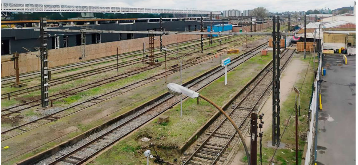
La estructura gruesa que es perfectamente fácil de advertir desde muchas calles del sector Ultraestación.

En la empresa explican que por problemas de ingeniería, la obra se ha atrasado en sus plazos que originalmente concluían en julio del año pasado. Edificio permitirá la modernización y mejoramiento de andenes para las estaciones de todo el tramo Rancagua-Chillán.