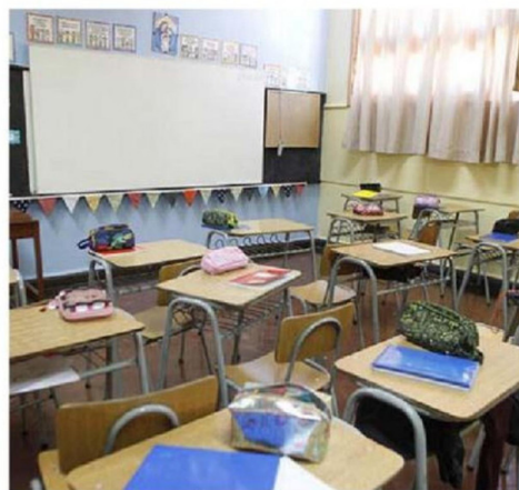
EXISTE GRAN PREOCUPACIÓN ENTRE LOS PADRES POR EL FENÓMENO.

"Es importante -manifiesta- no perder de vista ese ángulo,