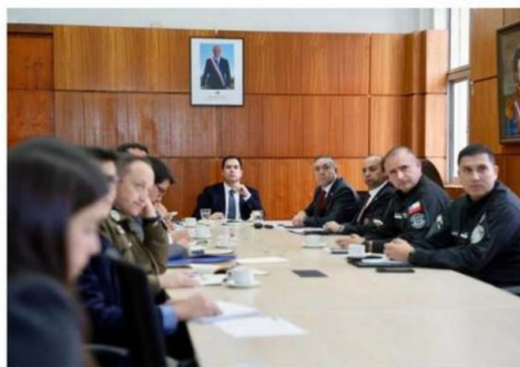
LA SITUACIÓN FUE ABORDADA EN ÑUBLE LA SEMANA PASADA.

lares, efectivamente se ha visto en la evidencia comparada -sobre todo en Estados Unidos, que tienen masacres escolares aproximadamente cada seis meses-, lo que le llaman el efecto copycat".