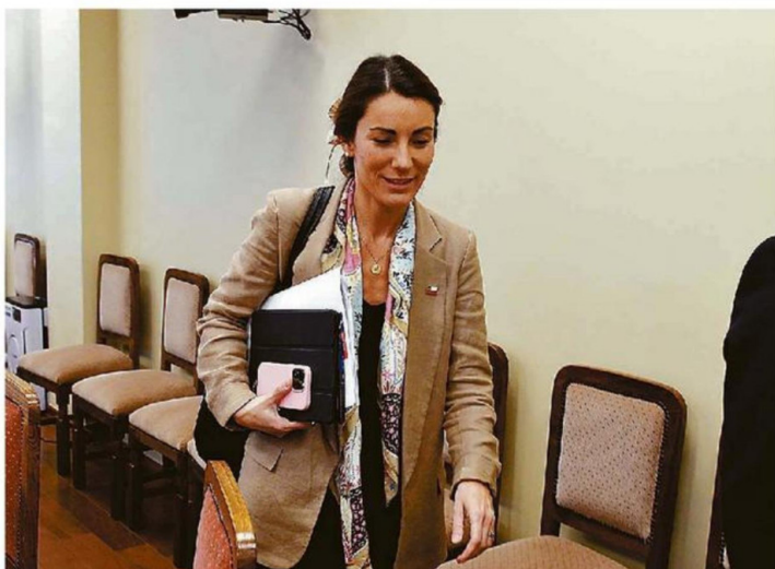
LA MINISTRA DE EDUCACIÓN LOGRÓ QUE EL PROYECTO DE ESCUELAS PROTEGIDAS PASARA RÁPIDAMENTE A SALA.