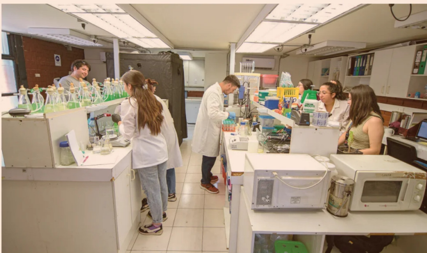
El modelo Usach articula investigación aplicada, propiedad intelectual y transferencia, consolidando la salida de tecnologías al mercado.