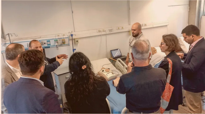
Docentes y estudiantes de UDLA y Duoc UC presentan a autoridades el modelo de simulación clínica que dio origen a la primera patente conjunta entre ambas instituciones.

En ese contexto, la discusión en el ecosistema ha comenzado a desplazarse desde la producción científica hacia la conexión