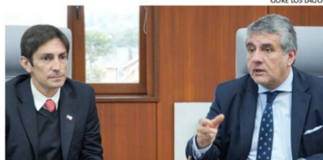
A NIVEL REGIONAL SE REALIZÓ EL ANÁLISIS DEL PROYECTO.

En la instancia, se dio cuenta de que uno de los principales impactos del proyecto será la reducción en el costo del servicio para