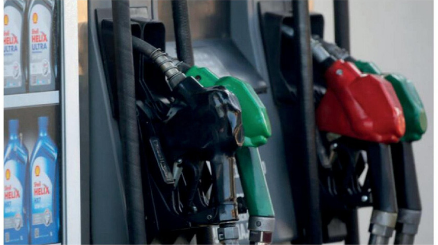
EL ALZA SOSTENIDA DE LOS COMBUSTIBLES está impactando la operación diaria del transporte en Los Ángeles, con gremios que advierten una creciente presión económica en el sector.