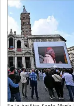
En la basílica Santa María la Mayor, donde está sepultado, y en distintos países se efectuaron homenajes al cumplirse un año del fallecimiento del Papa Francisco. | A 5

Cómo una ONG chilena que usa el fútbol como herramienta de desarrollo para los niños llegó a ganar prestigioso premio. | A 8