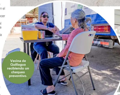
Vecina de Quillagua recibiendo un chequeo preventivo.