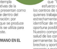
Vecina de Quillagua recibiendo un chequeo preventivo.