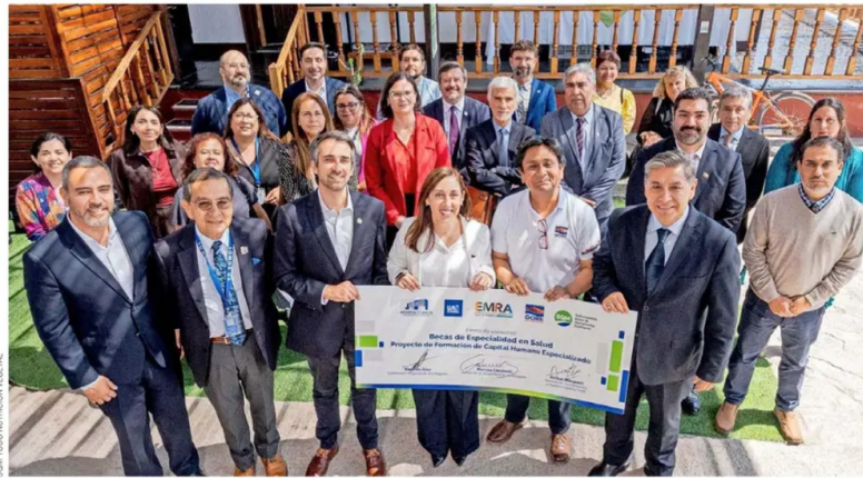
Firma de Becas de Especialidad con Sello EMRA.

A estos operativos se suman los proyectos de atención médica integral en María Elena y Quillagua. Junto a la Municipalidad de María Elena y la Fundación Acrux, la compañía impulsa un proyecto que contempla más de 4.800 prestaciones médicas especializadas. Esta iniciativa partió gracias a un convenio firmado en octubre de 2025 y su primera etapa se inició con la instalación de una clínica móvil para levantar un diagnóstico sanitario que permita