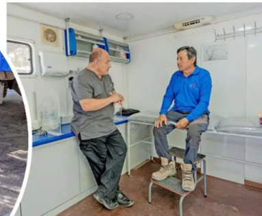
Vecino de Quillagua en atención kinesiológica.