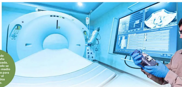
Equipo de tomografía computarizada, donde el yodo se utiliza como medio de contraste para mejorar el diagnóstico médico.

En un territorio donde la distancia y la geografía han sido históricamente sinónimo de desigualdad en salud, SQM ha optado por usar su presencia, sus capacidades y su negocio para acortar esas brechas. Desde el yodo que llega a los hospitales del mundo hasta las clínicas móviles que recorren el desierto, la compañía demuestra que el compromiso con la salud no es un gesto, sino una convicción que está en el centro de lo que hace.