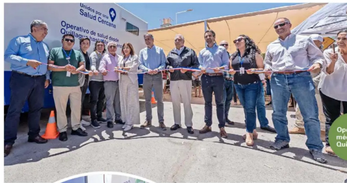
Operativo médico en Quillagua.