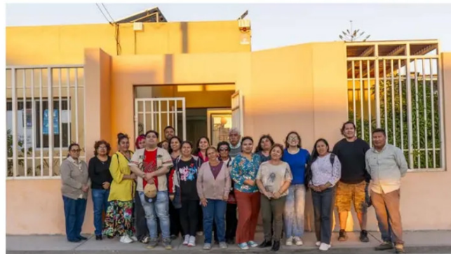
Rio Tinto Chile ha puesto el foco en el diálogo y la colaboración en etapas tempranas, como ocurre en Nuevo Cobre, proyecto que desarrolla en sociedad con Codelco.

Empleo local, educación técnica y sostenibilidad se consolidan como los ejes de trabajo de las principales compañías. Las empresas buscan profundizar el impacto de sus proyectos y avanzar hacia vínculos de largo plazo con su entorno.