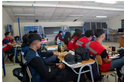
Teck está fortaleciendo el capital humano local mediante inversión en educación y formación técnico profesional.