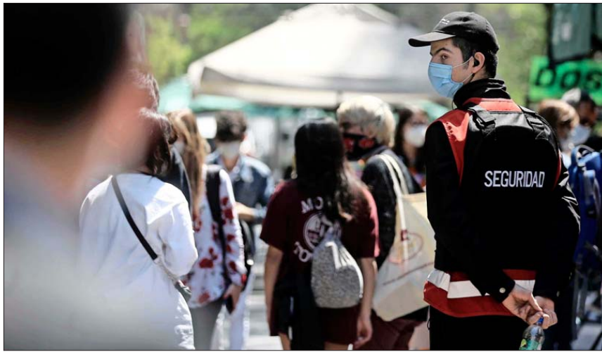
La mayoría de los encuestados aseguró que siente temor en el transporte público, incluso si se traslada en bicicleta o scooter .

Paraderos, estaciones de Metro y micros concentran la mayor percepción de inseguridad. Vecinos afirman que el temor es durante todo el día.