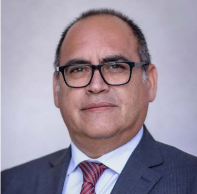
Desde 2006 a la fecha, el Servicio de Salud O'Higgins ha sido encabezado por una serie de autoridades en períodos marcados por importantes proyectos de infraestructura, crisis sanitarias y constantes desafíos administrativos.

La sucesión de nombres en la dirección del Servicio de Salud O'Higgins refleja la complejidad de una institución clave para el funcionamiento de la salud pública regional. La falta de continuidad en el liderazgo