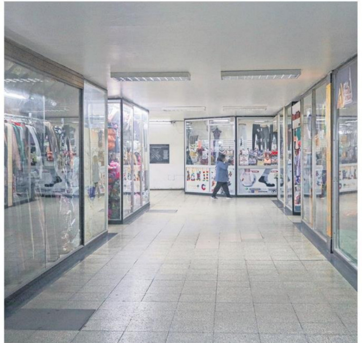
Menor circulación de personas en el centro penquista ha impactado al comercio durante marzo y abril.

Y es que según precisó, el valor de un espacio al interior de galerías parte desde el $1.000.000,