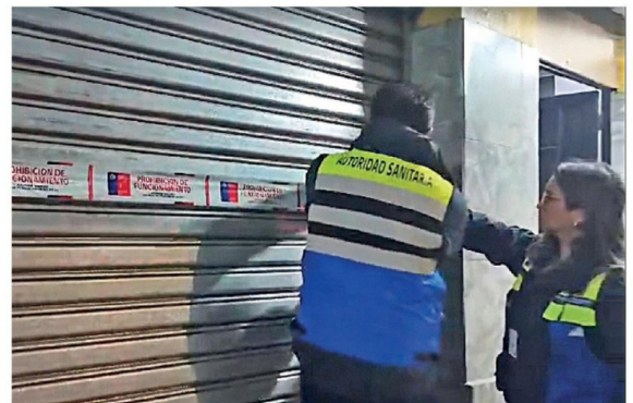
AUTORIDADES Y POLICÍAS DESPLEGARON un amplio operativo en el centro y la Vega Techada, que dejó como resultado clausuras, prohibiciones de funcionamiento y retiro de vehículos.

Las autoridades reiteraron que este tipo de operativos continuará desarrollándose en distintos puntos de la provincia, con el objetivo de reforzar la seguridad, el orden y el cumplimiento de la normativa vigente en espacios de alta actividad comercial.