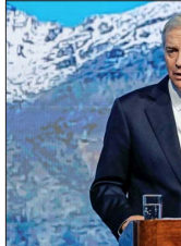
El Presidente expuso en el seminario Latam Focus, organizado por BTG Pactual.

"De aprobarse, puede marcar un antes y un después en el desarrollo de nuestra patria", dijo ayer en la Moneda el Presidente José Antonio Kast, al firmar el proyecto de ley de Reconstrucción Nacional.