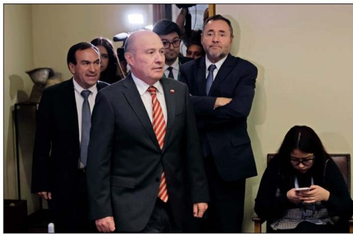
El ministro de Hacienda, Jorge Quiroga, junto a la Dipres, expuso ayer los cálculos del informe financiero.

El Presidente José Antonio Kast ayer participó en el seminario de BTG.