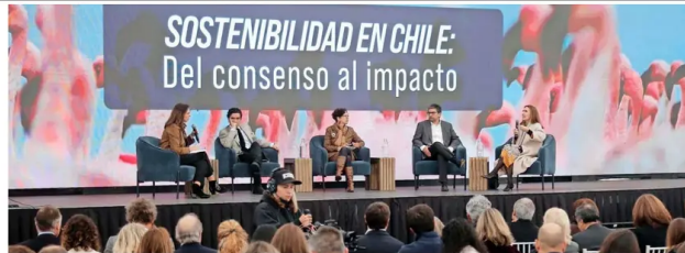
AUTORIDADES, LÍDERES EMPRESARIALES Y EXPERTOS SE REUNEN EN "EL MERCURIO" | A - 15

Exministros ponen foco en la reforma al SEA y en los temas ambientales que han quedado postergados.