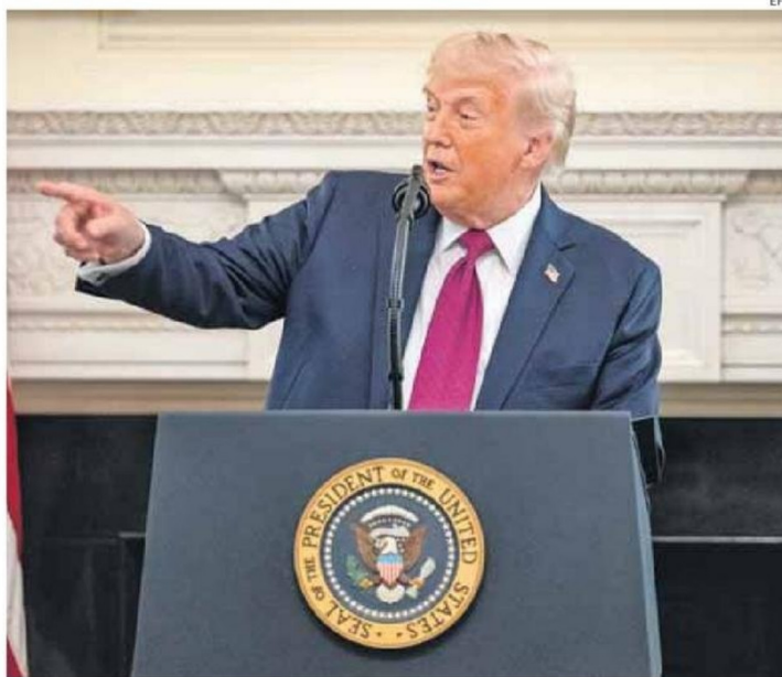
TRUMP ESPERA RETOMAR MAÑANA LAS NEGOCIACIONES CON EL GOBIERNO IRANÍ.