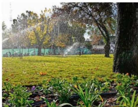
FINANCIAMIENTO PROVIENE DEL FONDO DE DESARROLLO REGIONAL.