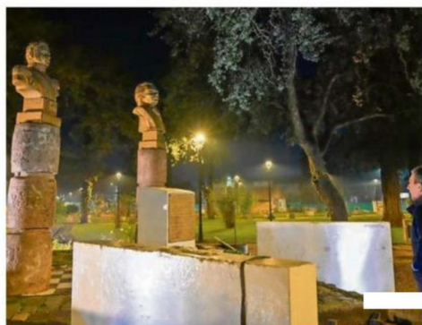
AUTORIDADES REALIZARON VISITA INSPECTIVA.