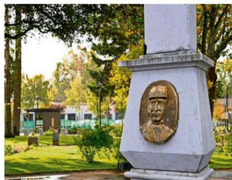
SECRETARÍA DE PLANIFICACIÓN SE ENCARGÓ DEL PROYECTO.