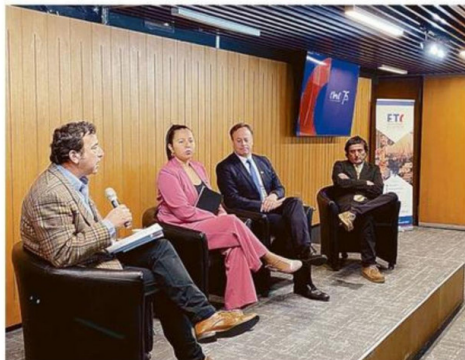
LA INSTANCIA FUE GUIADA POR ACTORES PÚBLICOS Y PRIVADOS.

Entre los motivos que explican el estancamiento de las soluciones habitacionales para este estrato están la baja creación de