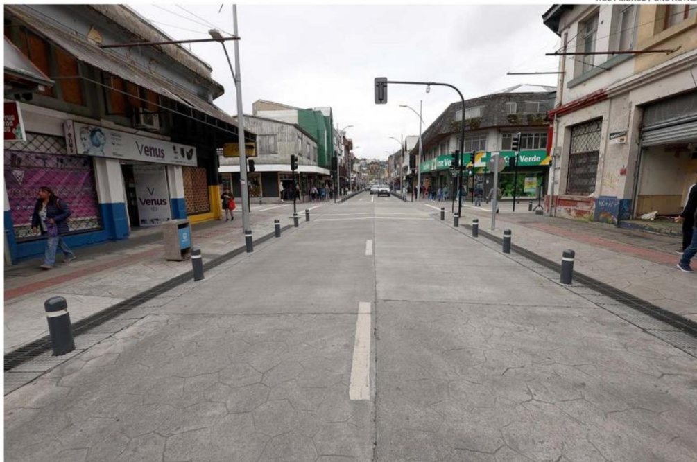
LA CALLE ANTONIO VARAS ES UNA DE LAS ARTERIAS DONDE BUSCARÍAN ERRADICAR EL COMERCIO SEXUAL DE PUERTO MONTT.