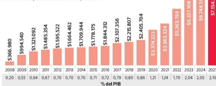
Gasto anual real en beneficios del Pilar Solidario En millones de pesos totales de 2025 y % del PIB