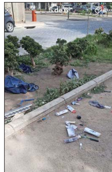
RIESGOS.— Habitantes alertan del riesgo sanitario de los desechos.