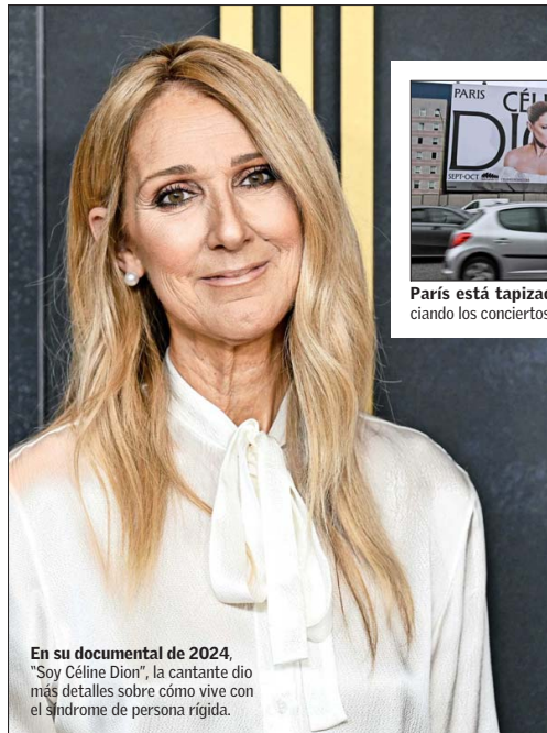
En su documental de 2024, "Soy Céline Dion", la cantante dio más detalles sobre cómo vive con el síndrome de persona rígida.

El anuncio de su regreso a los escenarios ha causado gran revolución entre los fans de la cantante, y especialmente en París. Inicialmente, se habían anunciado 10 conciertos en La Défense Arena, un recinto que puede acoger un máximo de 45 mil personas, ubicado en la comuna de Nanterre. Pero, después de que nueve millones de fans se inscribieran para la preventa, se sumaron seis recitales más, que la cantante dará entre septiembre y octubre de