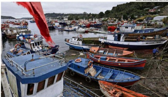
LA PESCA CONTRIBUYÓ PARA ALCANZAR EL 5,3% DE CRECIMIENTO EN LA ECONOMÍA DE LA REGIÓN.