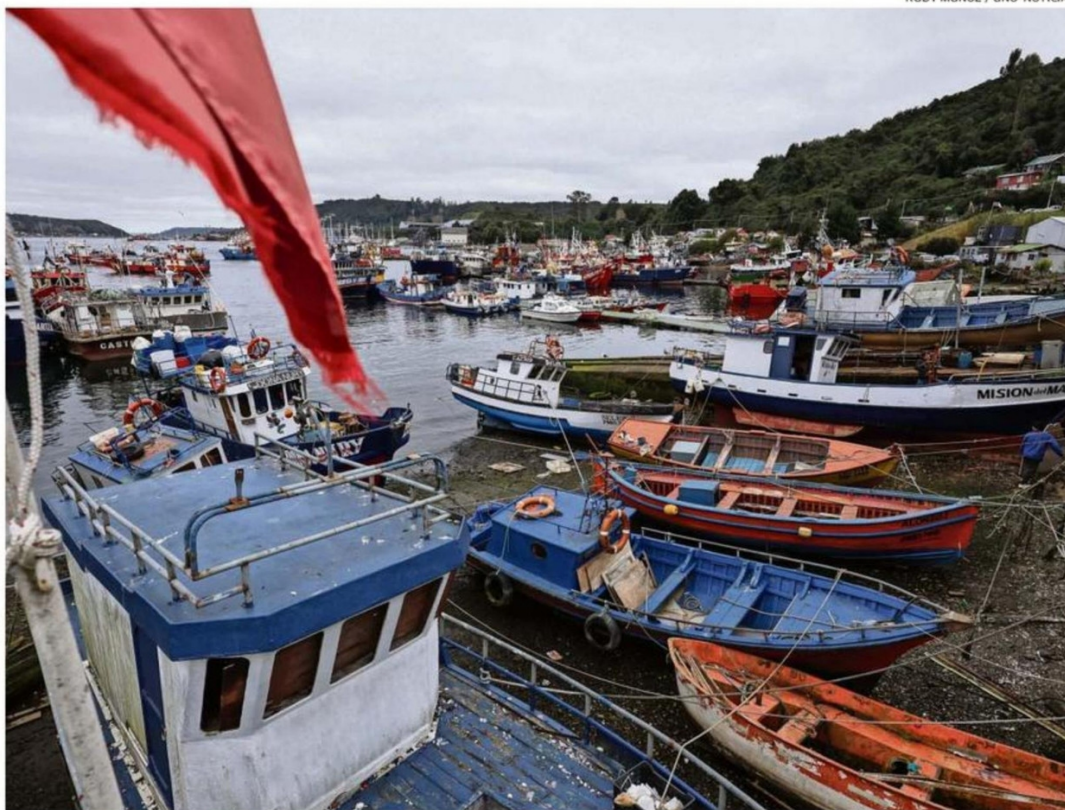
LA ACTIVIDAD PESQUERA TAMBIÉN CONTRIBUYÓ PARA ALCANZAR EL 5,3% DE CRECIMIENTO EN LA ECONOMÍA DE LA REGIÓN DE LOS LAGOS.