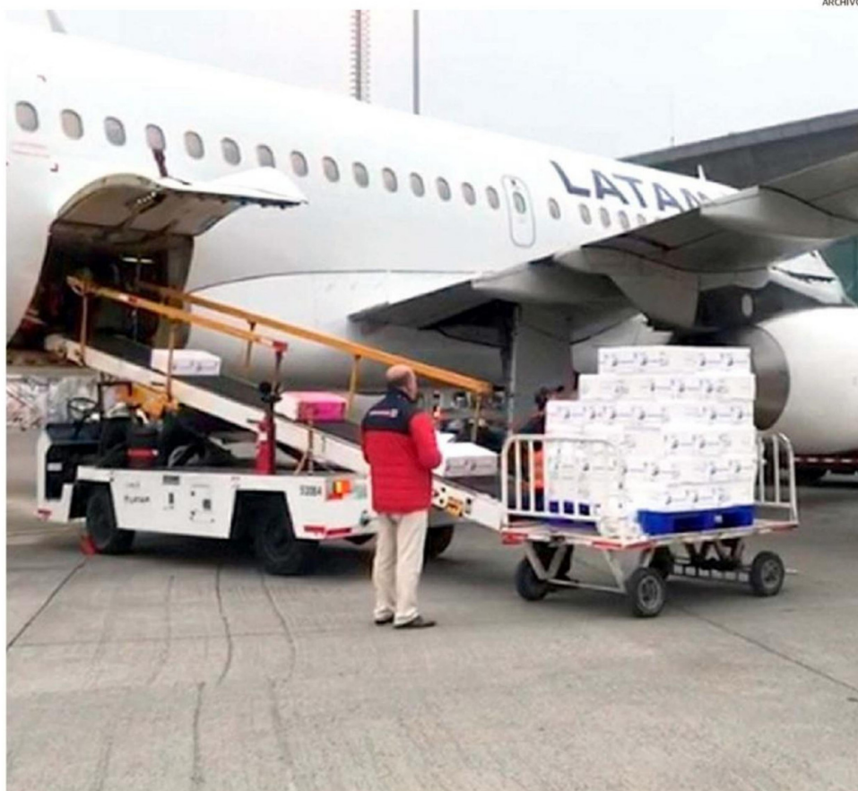
LAS EXPORTACIONES DE SALMÓN CONTRIBUYERON EN FORMA IMPORTANTE A EMPUJAR EL CRECIMIENTO ECONÓMICO DE LA REGIÓN DE LOS LAGOS.

Otro ítem que consideró este reporte del Banco Central es el de exportaciones regionales de bienes y servicios, índice