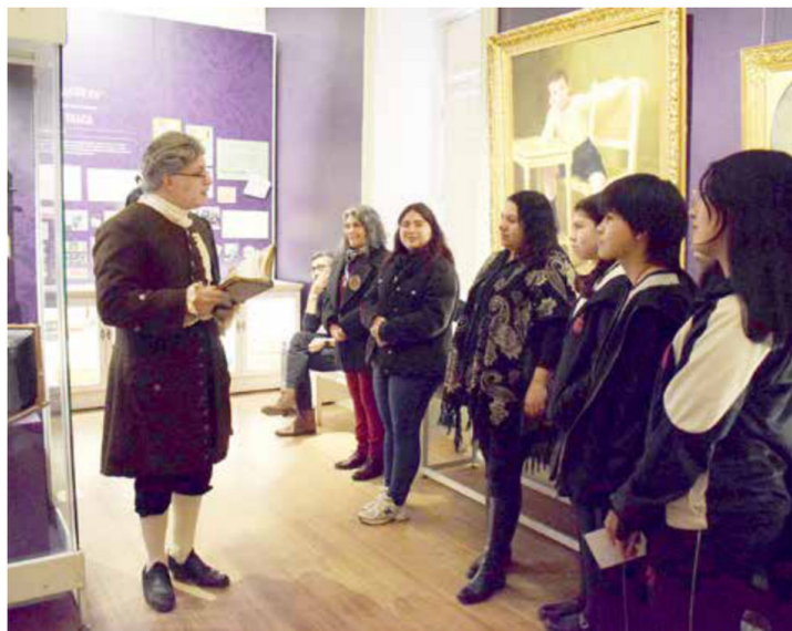
Alumnos del Colegio Juan Ignacio Molina compartieron con el prócer en primera persona.