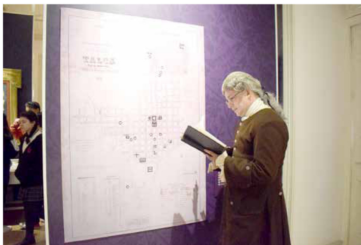
El Abate en persona recitó la poesía de su autoría frente a los alumnos presentes en el Museo.