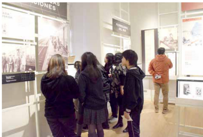
Sumado a la presencia del Abate, los alumnos participaron del recorrido del museo, en una lúdica salida a terreno.

muy participativa al permitir la interacción entre los jóvenes y el Abate Juan Ignacio Molina, quienes rápidamente adoptaron el espíritu del Día del Libro, compartiendo sus dudas, además de sus vivencias personales en el museo.