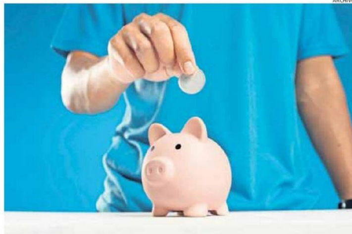
LAS FAMILIAS CHILENAS ESTÁN BUSCANDO MANERAS DE AHORRAR ANTE EL ALZA DE LOS PRECIOS.

INFLACIÓN. En medio del encarecimiento de bienes y servicios en Chile, especialistas y organismos entregan consejos para reducir el gasto, desde el uso eficiente de la energía hasta decisiones de compra más conscientes.